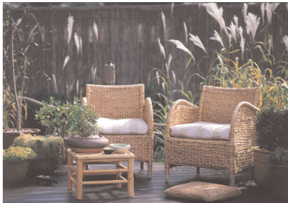
BALRA FENT képalírás BALRA LENT képalírás JOBBRA képalírás